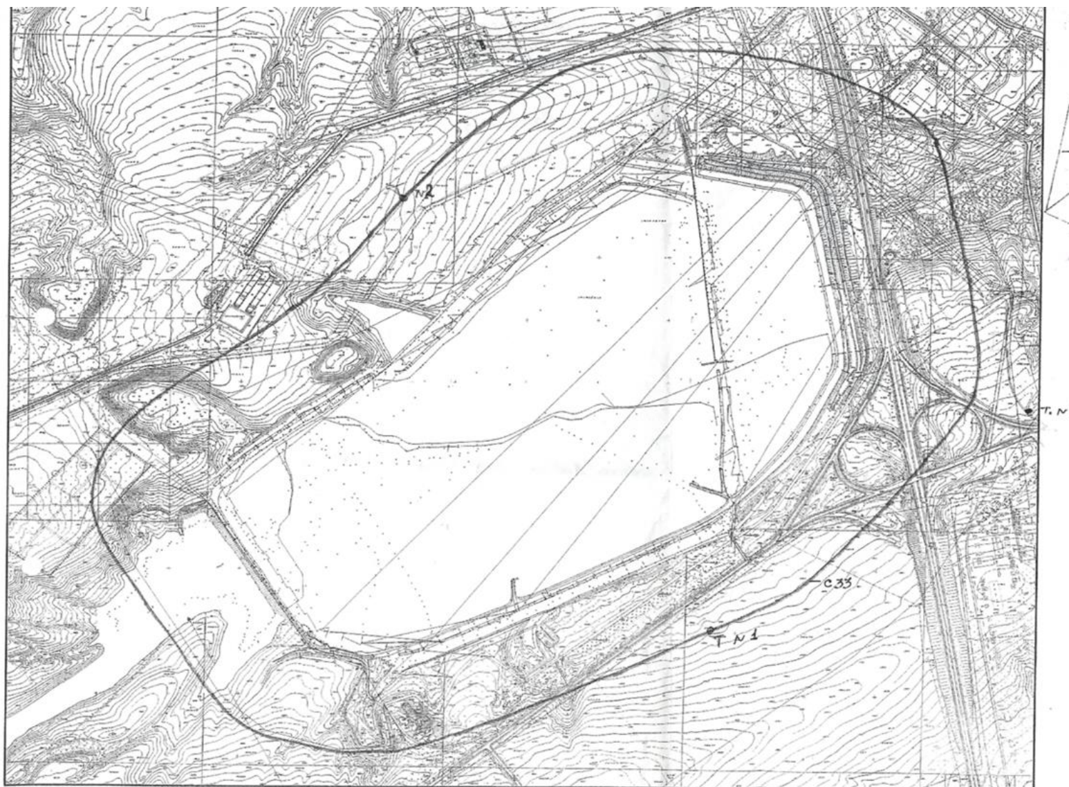
Рисунок 4 – Карта-схема расположения точек мониторинга почвенного покрова