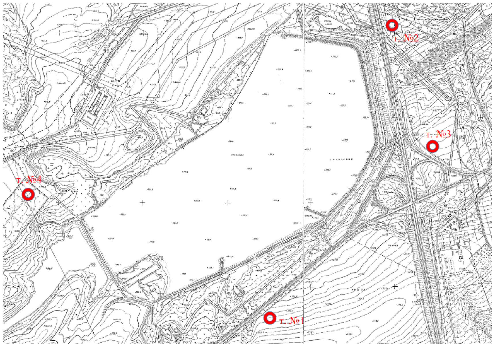
Рисунок 2 - Карта-схема расположения точек мониторинга атмосферного воздуха